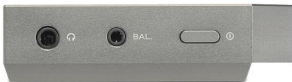
3,5-mm-Klinke für Line und 2,5 mm für symmetrische Endgeräte, rechts wird ein- oder ausgeschaltet

Produktionen war alles vertreten. Die Personal Files von Johnny Cash ziehe ich gern zum Vergleich heran. Ein Mikro, ein Mann und seine Gitarre – was so simpel scheint, steckt voller Fallen. Digitaltechnik muss sich dabei gegen die Schallplatte in Kategorien wie Abbildungsgröße, Feindynamik und emotionaler Ansprache beweisen. Mit unglaublichem Gespür für Timing folgt der AK240 dem schleppenden Swamp-Blues-Rhythmus von „Louisiana Man“, der nur von Cashs Stimmmodulation vorgegeben wird. Am Ende möchte ich begeistert applaudieren, nicht