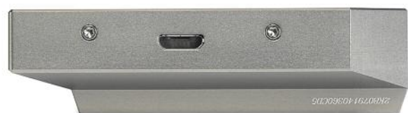
Auf der Unterseite findet sich nur ein Micro-USB-Port zur Datenübertragung oder zum Laden des Akkus