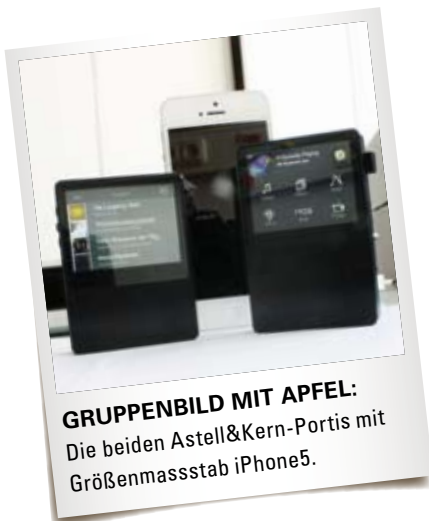
GRUPPENBILD MIT APFEL: Die beiden Astell&Kern-Portis mit Größenmassstab iPhone5.

toppen. Mit - klar - Gapless-Playback, gleich zwei Spitzen-Wandlern vom Typ Wolfson WM8740, größerem internen Speicher (64 Gigabyte) samt zwei Steckplätzen für jeweils nochmals bis zu 64 GB fassende Micro-SD-Karten, und einem leistungsstärkeren Lithium-Polymer-Akku. Auch der Ausgangswiderstand wurde gesenkt – auf dem Papier sind es nun drei Ohm, im AUDIO-Messlabor nachgewiesene fünf Ohm – und dürfte nun mit fast jedem Kopfhörer gut harmonieren. Zusätzlich haben sich die Koreaner auch noch ein bisschen Gedanken um die Bedienung gemacht, das User Interface optimiert und neu gestaltet – so startet der AK120 direkt mit einem Icon-Menü statt nüchterner Optionsliste. Treu blieb man den bewährten Tugenden wie das auf 150 Stufen regu-